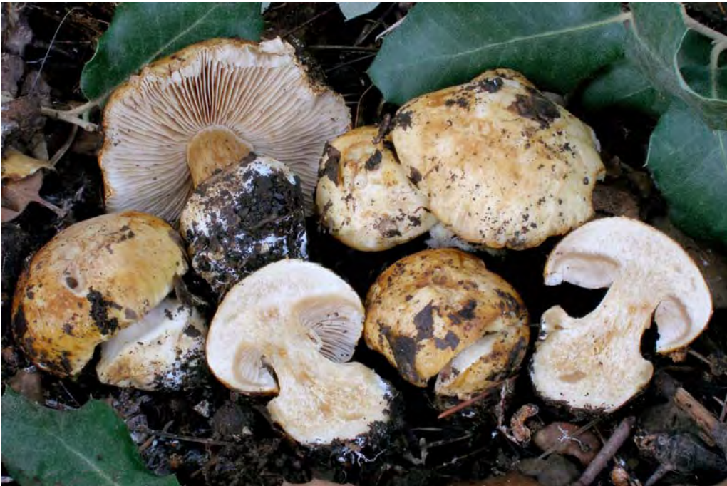
Cortinarius rioussetorum Bidaud, Moënné- Locc. & Remaux