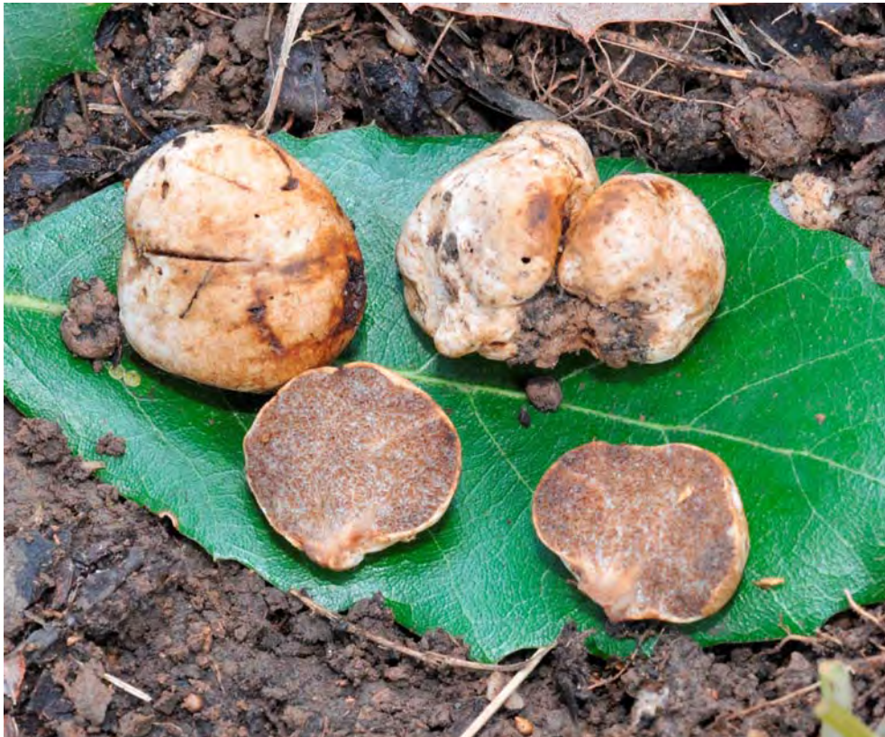
Hymenogaster populetorum Tul & C. Tul.