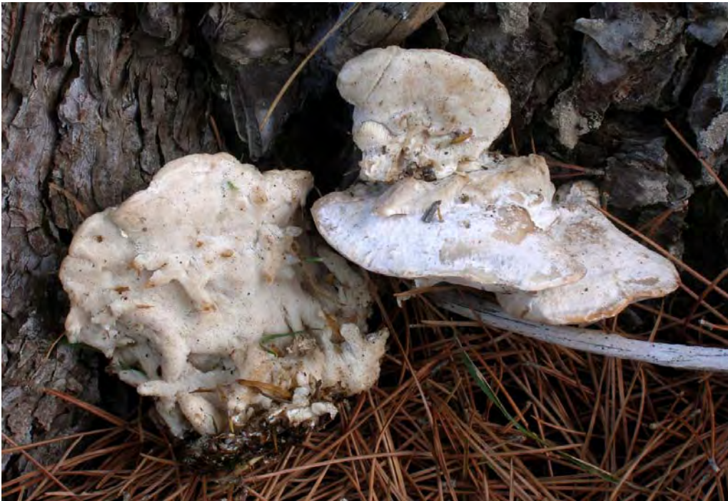
Fomitopsis iberica Melo & Ryvarden